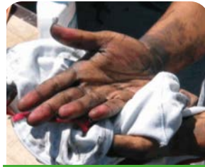
Industrias y talleres